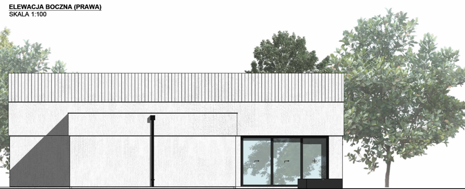
ELEWACJA BOCZNA (PRAWA) SKALA 1:100